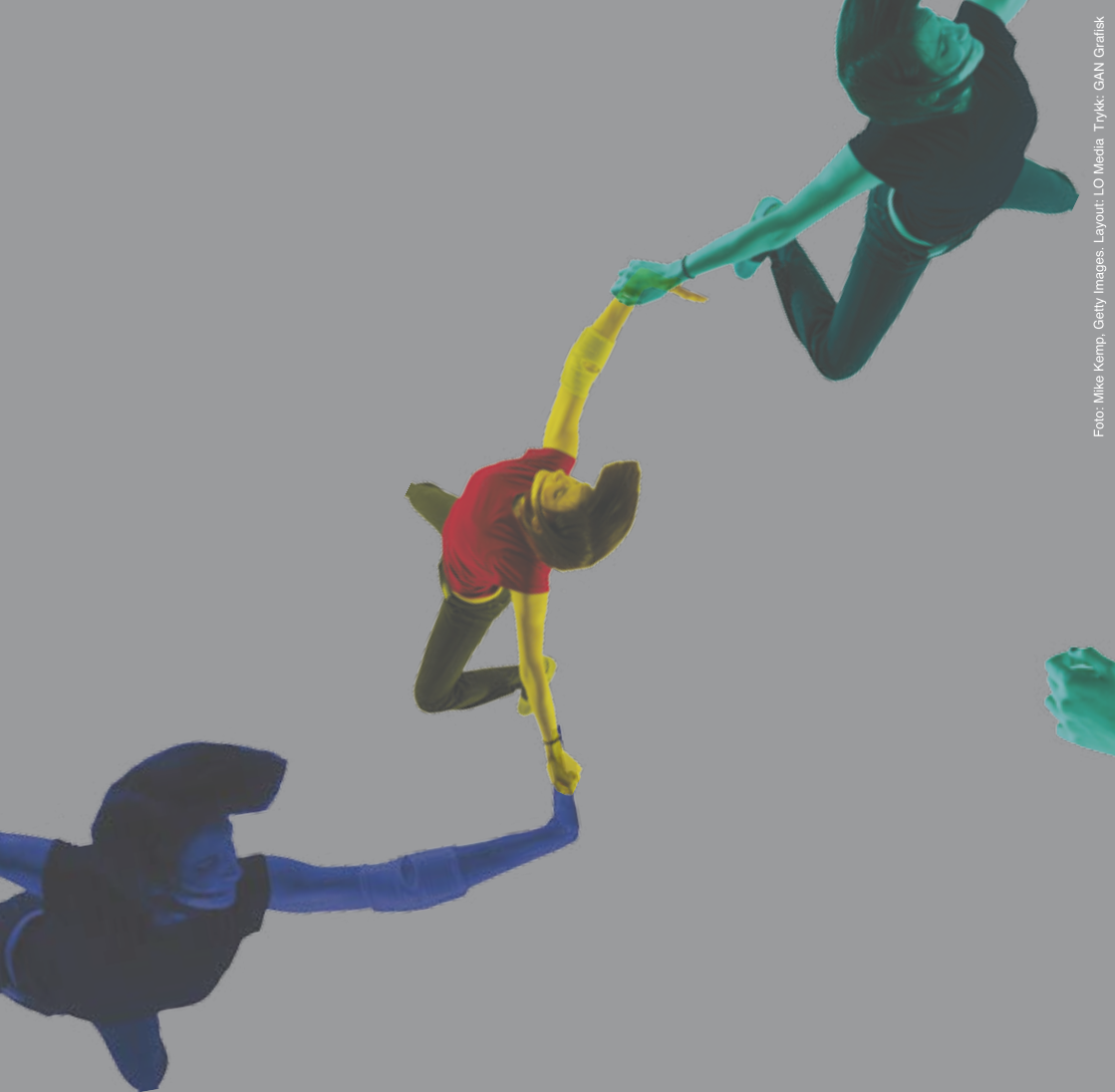
Layout: LO Media. Trykk: GAN Grafisk

Denne brosjyren er utarbeidet av Arbeidsutvalget for faggruppen for sykehussosionomer i FO.